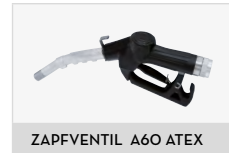
ZAPFVENTIL A60 ATEX