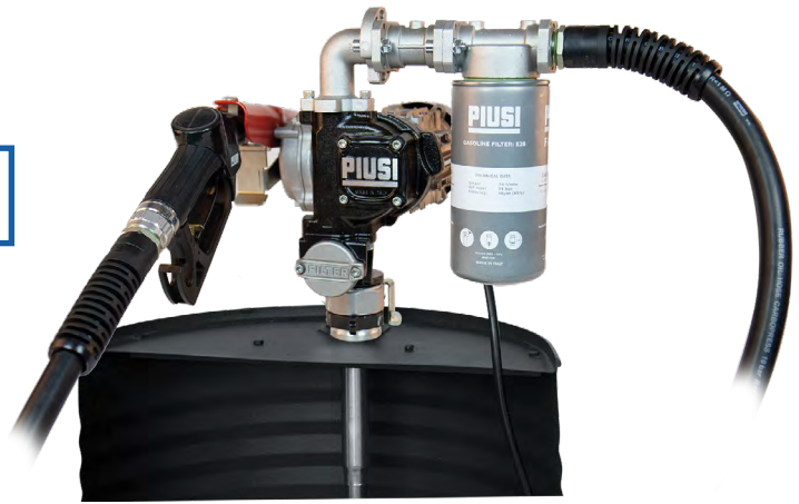
PANTHER EX 56 DRUM FO0582000