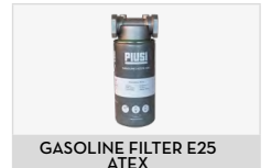
GASOLINE FILTER E25 ATEX