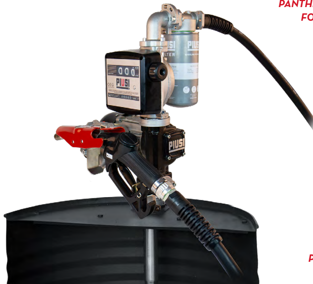
PANTHER EX 56 DRUM FO0582010