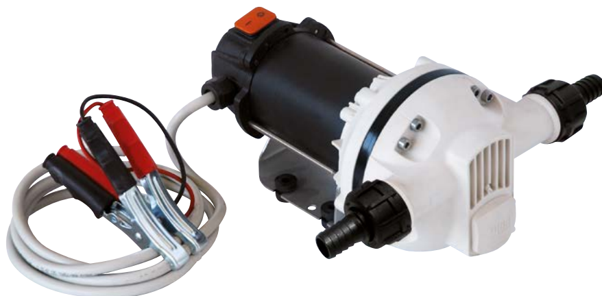
SUZZARABLUE PUMP DC