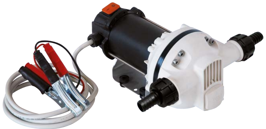
SUZZARABLUE PUMP DC