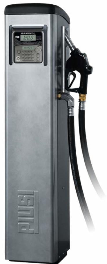
SELF SERVICE MC