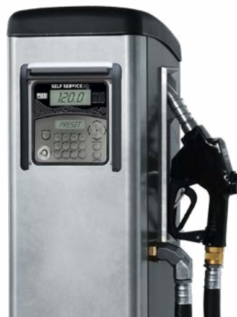
ELECTRONIC METER INTEGRATED

Aggiorna il Tuo sistema MC a B.Smart con il KIT UPGRADE 1.0/2018.