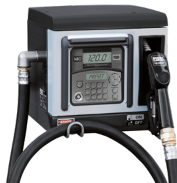
CUBE 70 MC