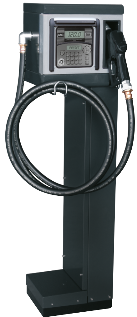
CUBE 70 MC MIT SOCKEL (OPTIONAL)