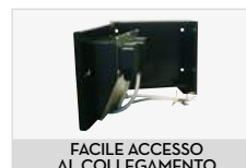
FACILE ACCESSO AL COLLEGAMENTO