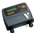
INDICATORE DI LIVELLO