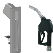
INTERRUTTORE PISTOLA CON A60