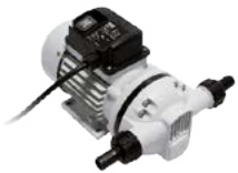
SUZZARABLUÉ PUMP AC