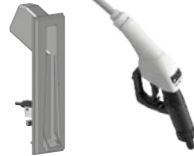
NOZZLE SWITCH WITH SB325_X