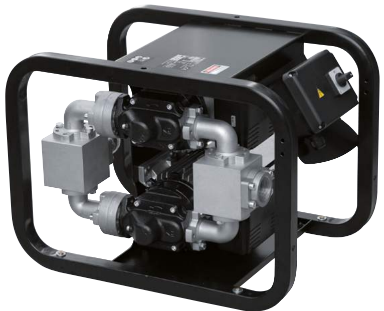
ST 200 AC