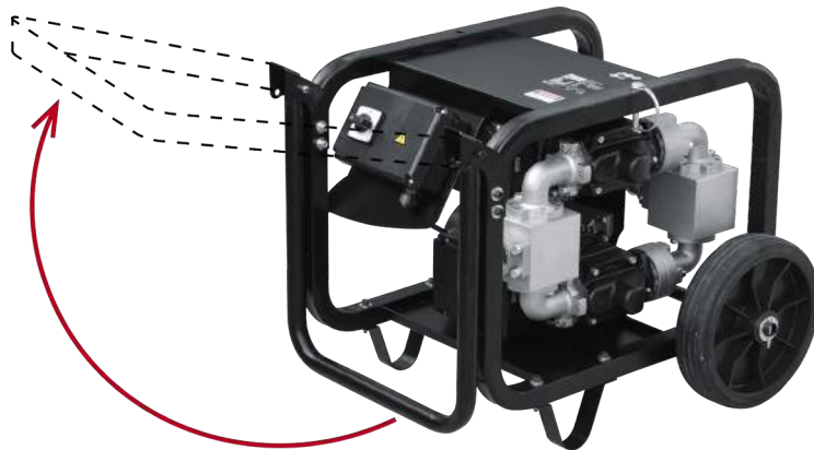
PRAKTISCHES KIT: AUSFÜHRUNG MIT RÄDERN UND GRIFF