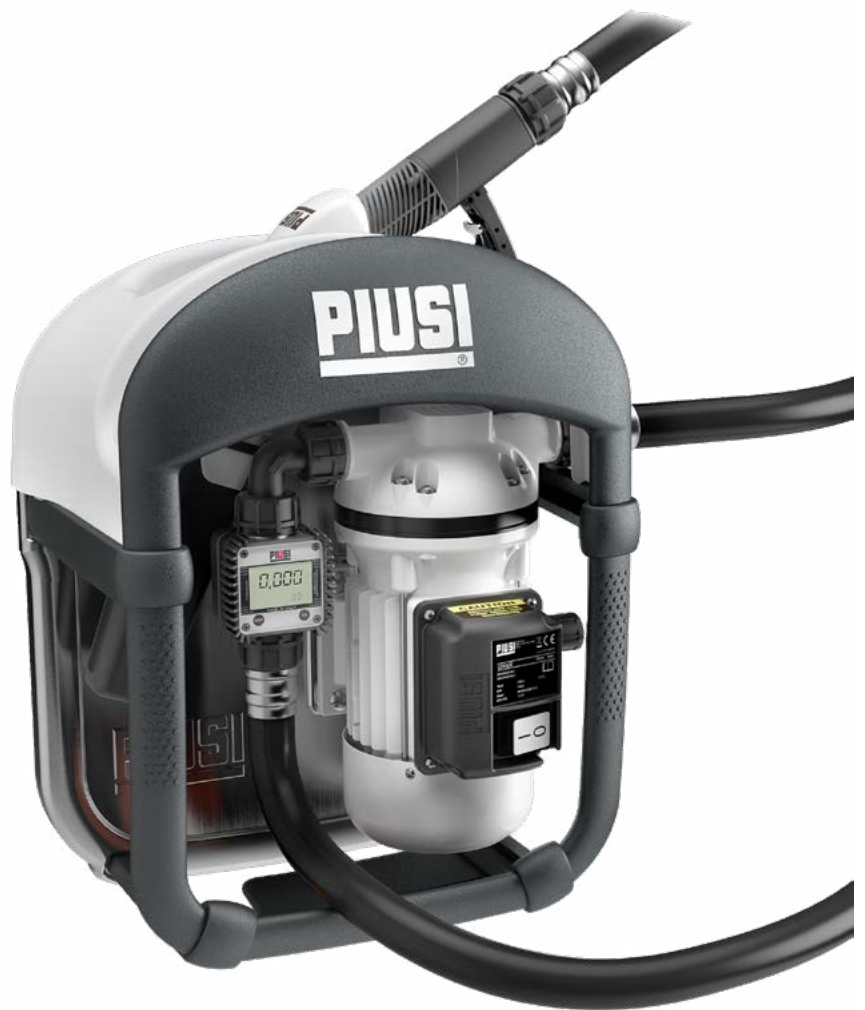
SUZZARABLUE 3 PRO

SUZZARABLUE 3 PRO ist die Spitze des PIUSI- Sortiments für den Transfer von AdBlue® aus einem IBC-Tank. Sie eignet sich für alle Arbeitsbedingungen und alle Nutzfahrzeuge. Die technischen Eigenschaften und die Leistungsmerkmale der Version SUZZARABLUE 3 BASIC werden mit der Präzision des Literzählers K24 für AdBlue® oder der Literzählerpistole SB325_X METER ergänzt.