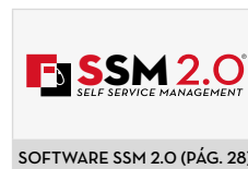
SOFTWARE SSM 2.0 (PÁG. 28)