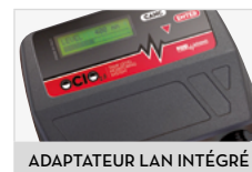
ADAPTATEUR LAN INTÉGRÉ