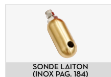
SONDE LAITON (INOX PAG. 184)