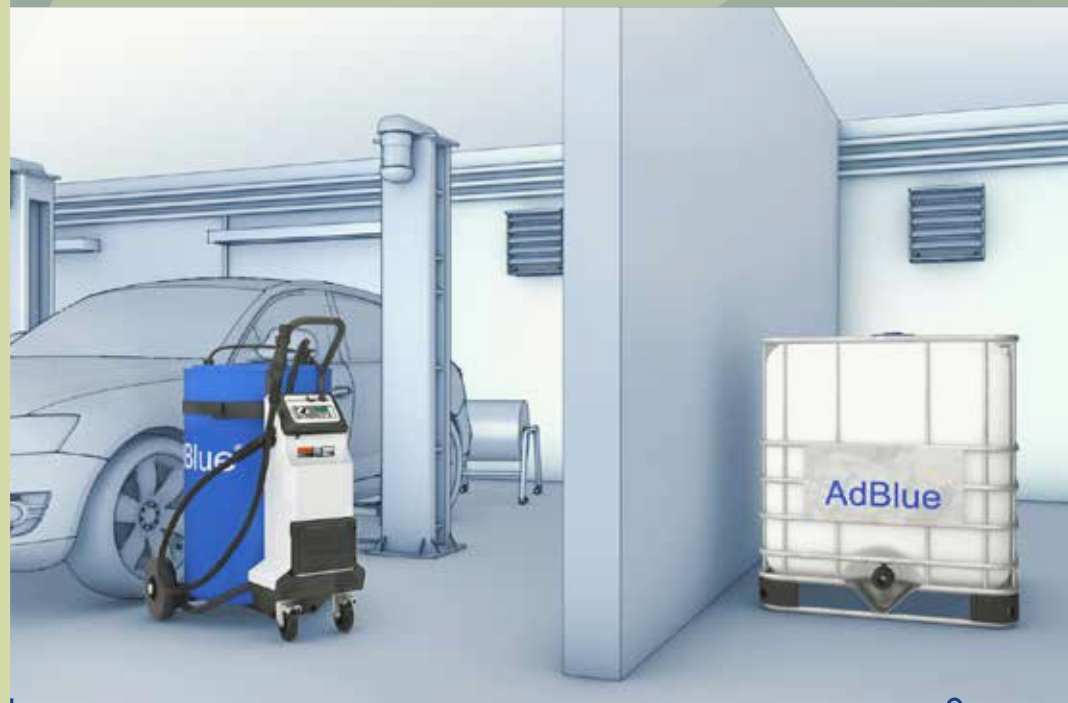
» GAMME MOBILE DELPHIN PRO ET RÉSERVOIR IBC

Distributeur mobile facile à remplir grâce à un réservoir IBC AdBlue® posé à distance.