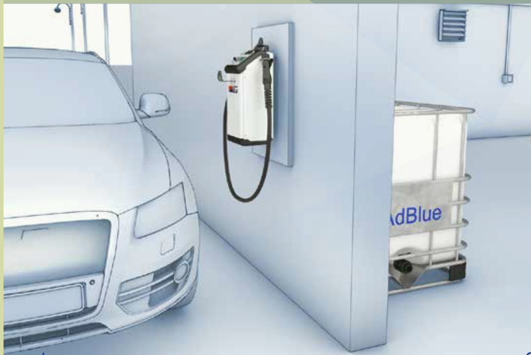
» DELPHIN PRO AC IBC

Des installations fixées au mur à l'extérieur des garages ou ateliers, avec le réservoir IBC AdBlue® installé dans le garage ou dans un endroit qui lui est réservé.