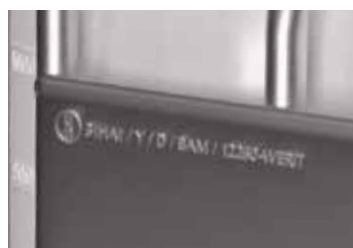
Marquage UN UN 31 HA1/Y/D/BAM