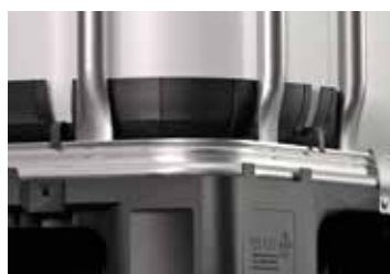
Cornières de protection