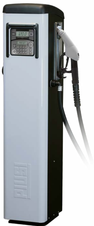
SELF SERVICE MC 2.0