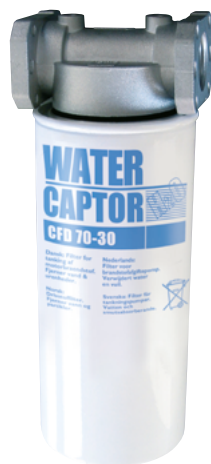
WATER CAPTOR 70 L/MIN AVEC ABSORPTION D'EAU