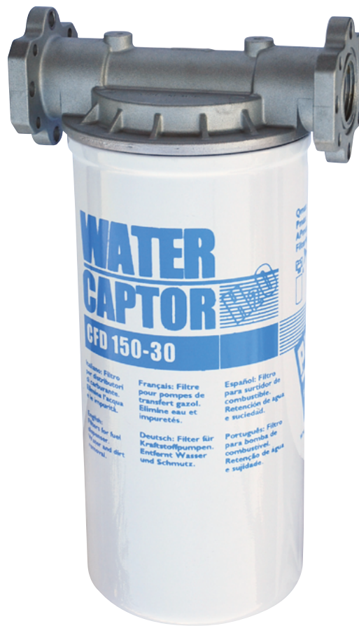
WATER CAPTOR 150 L/MIN