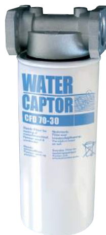
70 L/MIN WATER CAPTOR MIT WASSERABSORPTION