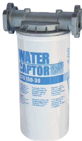
150 L/MIN WATER CAPTOR MIT WASSERABSORPTION