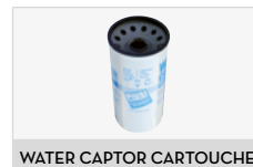
WATER CAPTOR CARTOUCHE