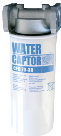
WATER CAPTOR 70 L/MIN AVEC ABSORPTION D'EAU