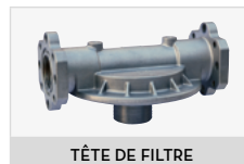
TÊTE DE FILTRE