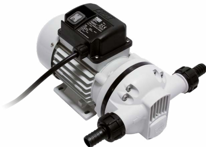
SUZZARABLUE PUMP AC