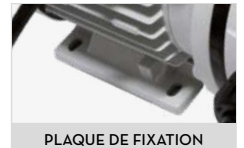
PLAQUE DE FIXATION