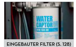
EINGEBAUTER FILTER (S. 128)