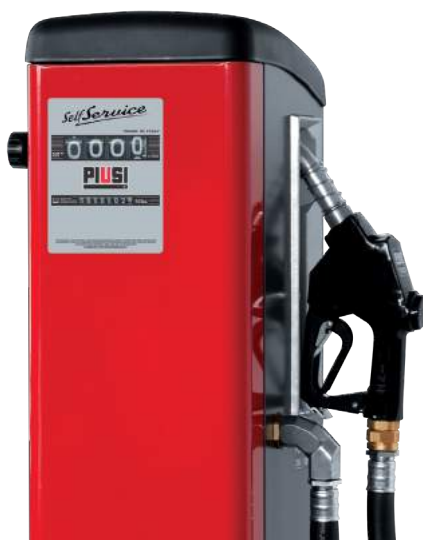
MECHANISCHER ZÄHLER EINGEBAUT