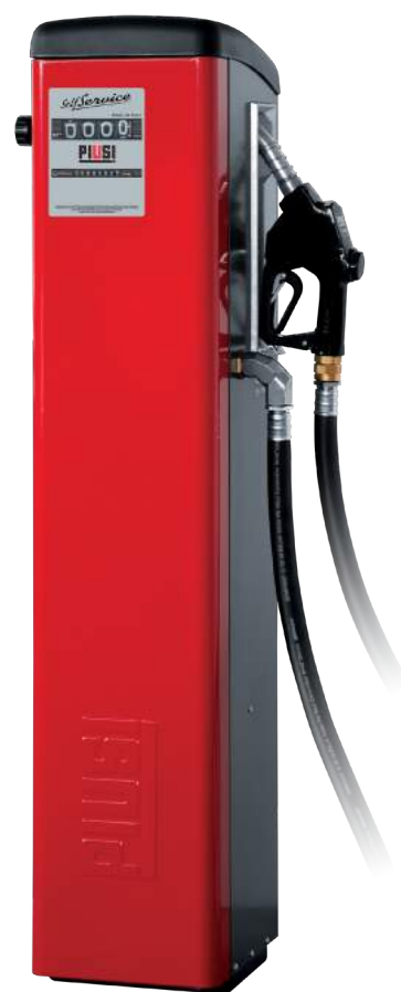
SELF SERVICE K44