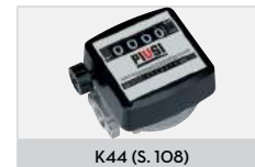
K44 (S. 108)