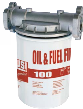
ÖL- UND KRAFTSTOFFFILTER