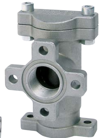
LINE FILTER 1-1