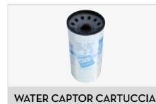
WATER CAPTOR CARTUCCIA