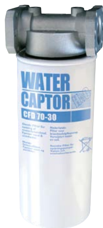
70 L/MIN WATER CAPTOR CON ASSORBIMENTO ACQUA