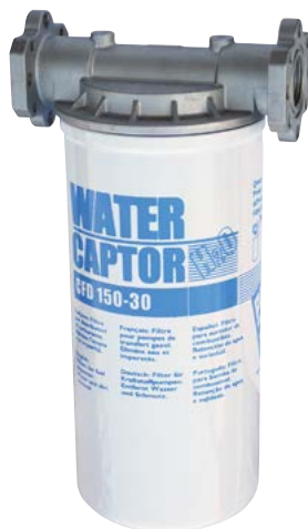
150 L/MIN WATER CAPTOR CON ASSORBIMENTO ACQUA