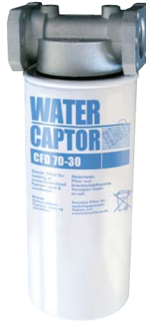
WATER CAPTOR 70 L/MIN AVEC ABSORPTION D'EAU