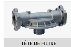
TÊTE DE FILTRE