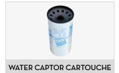
WATER CAPTOR CARTOUCHE