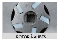
ROTOR À AUBES