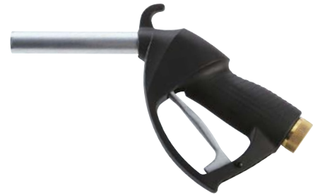
SELF 3000 DIESEL/GASOLINE