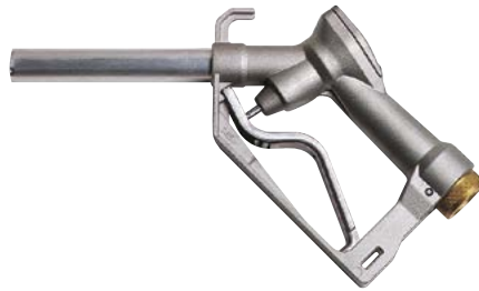
SELF 2000 DIESEL

Les pistolets manuels SELF 2000 / SELF 3000 de PIUSI offrent une efficacité maximale grâce à la résistance à bas débit et à la vaste gamme d'applications, y compris les systèmes de transvasement par gravité. Ils sont fournis avec une protection du levier amovible et des raccords.